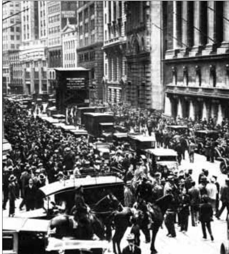
KRISER: Finanskriser oppstår når «sjetongene», selve pengene, vokser uproporsjonalt raskere enn realøkonomien og samtidig overtar makten. Her fra New York i 1929.

«Rentesrenten er verken den eneste eller den utløsende årsaken til finanskriser»