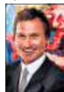
Har skjont det.

Hvorfor ikke skaffe enda noen flere kjøretøy, og gå i plass.