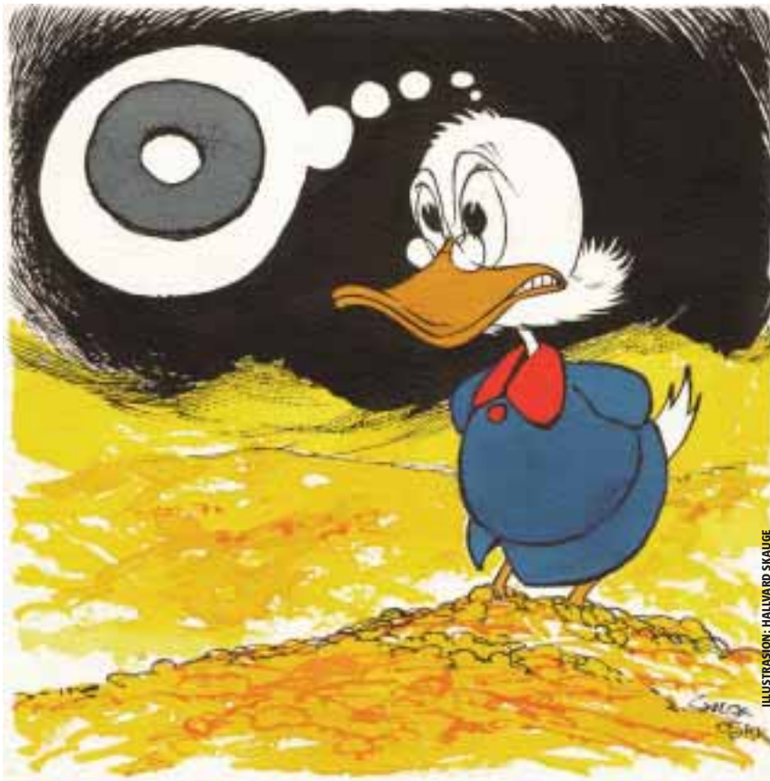
ILLUSTRASJON: HALVARD SKAUGE

I de periodene produksjonskapitalen dominerer, finner man kreative løsninger på hvorledes nasjonenes fellesgoder kan utnyttes til å skape velstand. Midt under den amerikanske borgerkrigen satte den amerikanske stat av 30.000 acres offentlig land for hver senator og medlem av representantenes hus i hver delstat. Disse midlene finansierte et universitet i hver eneste delstat, finansieringens størrelse var altså