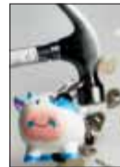
EU og sparepenger.

ger. Ingen anstrengelser blir skydd for å forsvare overtaket på meningsmålingene.