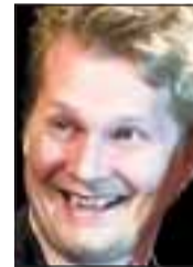
Siddis og osloborger.

borger, blir en godbit i historiebøkene.