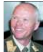
In the mood

VG gjenga i går et åtte siders kraftangrep på forsvarsminister Anne-Grete Strøm-Erichsen og forsvarssjef Sverre Diesen, på vegne av